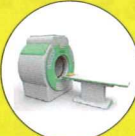
高度医療・バイオ