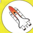
宇宙・エネルギー